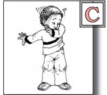
在咳嗽和打喷嚏时， 以肘部遮掩